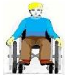
SILLA DE RUEDAS

El discapacitado es, ante todo, una persona como los demás. Frente a él, portaos con naturalidad. Sed vosotros mismos.